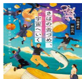
『さばの缶づめ、宇宙へいく』 538 小坂康之、林公代／イースト・プレス

日本全国にある昆虫館の数は22館。世界でもこんなにたくさんの昆虫館があるのは日本だけだそうです。この本では、昆虫館で働くスタッフが、「自分の館にはこんなにスゴイ昆虫がいます!」という魅力ある昆虫を紹介(自慢?)しています。それぞれの昆虫の推しポイントが楽しいです!