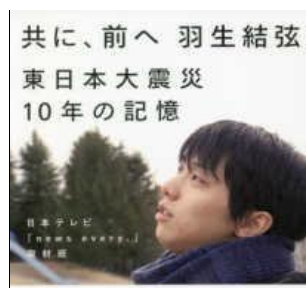
『共に、前へ 羽生結弦』 分類 784 日本テレビ取材班／祥伝社

JAXA(宇宙航空研究開発機構)が認める「宇宙日本食」は現在47品目。ラーメン、焼き鳥など大手食品メーカーばかりの中に、福井県小浜水産高校の生徒が開発した「さば缶」が。「宇宙食、つくれんちゃう?」の一言からはじまった生徒たちのチャレンジをたどります。