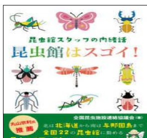
『昆虫館はスゴイ!』 分類 全国昆虫施設連絡協議会/

1年生は中学生になったばかりなので、さまざまなことが新鮮だと思います。小学校とは違い、自分で日々の活動を計画し、管理し、実行していくことが必要となってきます。この3年間は高校生になるうえでも土台をつくる貴重な時間です。充実した中学生生活を過ごすヒントを紹介しています！