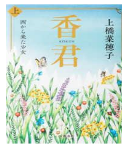
『香君 (こうくん)』 分類 913 上橋菜穂子／文藝春秋