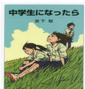
『中学生になったら』 分類 159 宮下聡／岩波書店

1年生は中学生になったばかりなので、さまざまなことが新鮮だと思います。小学校とは違い、自分で日々の活動を計画し、管理し、実行していくことが必要となってきます。この3年間は高校生になるうえでも土台をつくる貴重な時間です。充実した中学生生活を過ごすヒントを紹介しています！