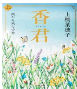
『香君 (こうくん)』 分類913 上橋菜穂子／文藝春秋

JAXA(宇宙航空研究開発機構)が認める「宇宙日本食」は現在47品目。 ラーメン、焼き鳥など大手食品メーカーばかりの中に、 福井県小浜水産高校の生徒が開発した「さば缶」が。 「宇宙食、つくれんちゃう？」の一言からはじまった 高校生たちのチャレンジをたどる。