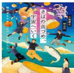
『さばの缶づめ、宇宙へいく』 538 小坂康之、林公代／イースト・プレス

春休み中に私は3回目のワクチン接種をしましたが、 今回は夜中から熱がでて、翌日は体全体がだるくなりました。 そもそも予防目的のワクチンって どういう歴史をたどり、 どういう種類があるのでしょうか？ そんなワクチンの効果やリスクも 含めわかりやすく解説。