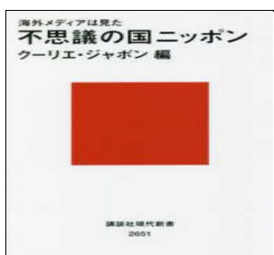
『不思議の国ニッポン』 分類302 クリエ・ジャポン編／講談社

なぜ日本では銀メダルでも謝罪をするのか、義理チョコっていったい何？ どうして寝室でもないのに電車内で寝てるの？など、海外からみたら不思議 いっぱいニッポン。NYタイムズや仏ル・モンドが報じた日本の「謎」を それぞれ解説。