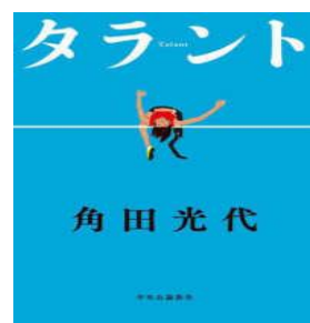
『タラント』 分類913 角田光代 / 中央公論新社

人並外れた臭覚(しゅうかく)をもつ少女アイシャは、 植物がどんな香の声を発しているのかを感じることが できる。そんなアイシャは香君とよばれるオリエと 出会い、どんな土地でも育ち、病害虫に強いオアレ 稲をめぐって国の存亡にかかわっていく。 上橋さんの新作もスケール大きく展開！