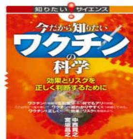
『ワクチンの科学』 分類493 中西隆之／技術評論社

図鑑をひらいたのに、どれも同じに見えて・・・、という経験はありませんか？ この本では、そんな「つまづき」を克服するためのポイントを紹介。 5種類のクモのうち、どのクモだけ違うのか、 というような写真のレッスンを うちに相違がわかってきますよ！